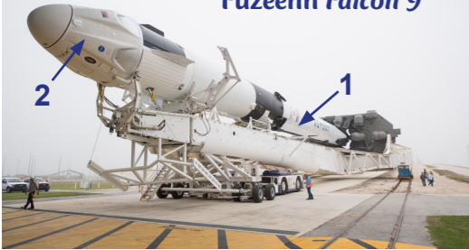
Fuzeenn Falcon 9

Ar wech-mañ ez eo gant ar fuzeenn savet gant ar stal Space X eo aet an astraerien di. Ur fuzeenn brevez an hini eo. An estaj kentañ (1) hag al lestr Crew Dragon (2) a c'hall bezañ implijet meur a wech.