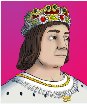
Frañsez II, duk Breizh (1435-1488)

Ar moullañ a erruas e Breizh e-pad ren Frañsez II, tad Anna Vreizh, 40 vloaz goude Gutenberg.