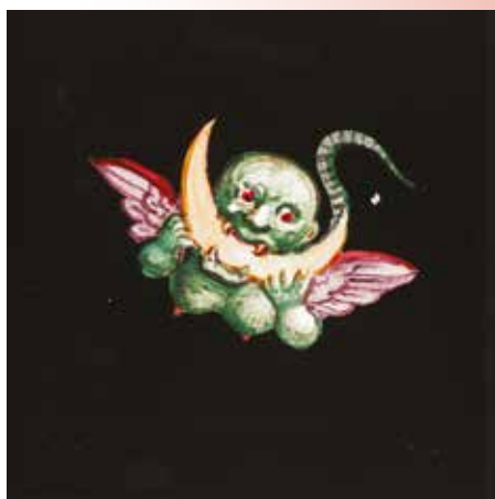
« Monstre ailé dévorant un croissant de lune », Vues pour fantasmagories, première décennie du XIX e siècle.