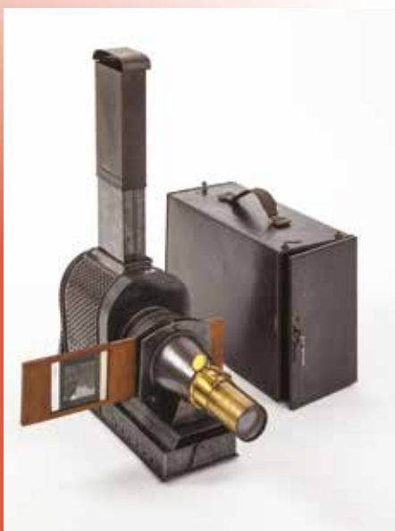
Lanterne de projection, vers 1890. Collections Musée national de l'Éducation.

Moins fragiles que les vues photographiques sur verre, et moins onéreuses, les vues sur papier, présentées en planches et parfois imprimées en couleur, font également leur apparition.