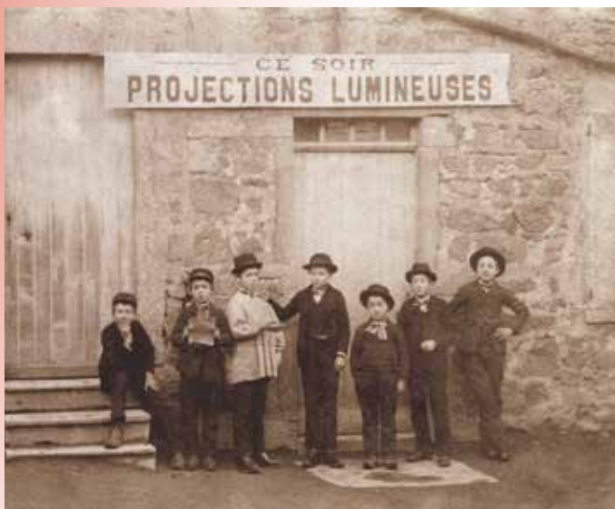
Photographie réalisée à l'occasion d'une séance de projections lumineuses organisée à l'école communale de Saint-Forgeux (Rhône) en 1895.

Afin d'étendre ce mouvement, le Musée pédagogique constitue en 1896 un service des vues. Celui-ci organise et étend la diffusion des plaques à projeter sur tout le territoire.