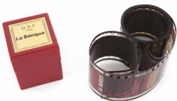
Film fixe La Banque édité par l'Office de Documentation par le Film, vers 1960.

Si la projection fixe connaît donc son véritable âge d'or à partir des années 1950 avec la démocratisation du film fixe, ce dernier est vite détrôné par la diapositive, plus flexible dans son usage, qui persistera jusque dans les années 2000 et avec laquelle disparaîtra le principe de projection d'images fixes transparentes.