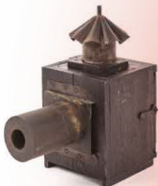
Lanterne primitive, vers 1780. Collection François Binetruy.

Cette première section s'intéresse aux débuts de la projection et à l'émergence de la lanterne magique au XVIII e siècle en France. « Pièce curieuse », elle se déplace de ville en ville sur le dos de colporteurs qui offrent des spectacles magiques, ludiques et mystérieux.