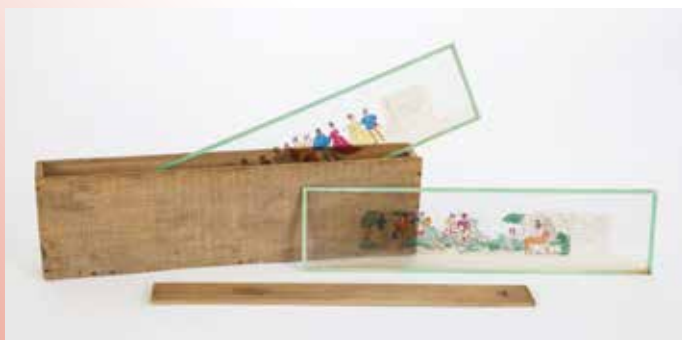
Geneviève de Brabant. Plaques de lanterne avec boîte de rangement, 1860. Collections Musée national de l'Éducation.

Les contes et fables connus occupent une place importante dans la production des plaques à usage familial. Leur iconographie sur verre est très largement inspirée de l'imagerie populaire de l'époque.