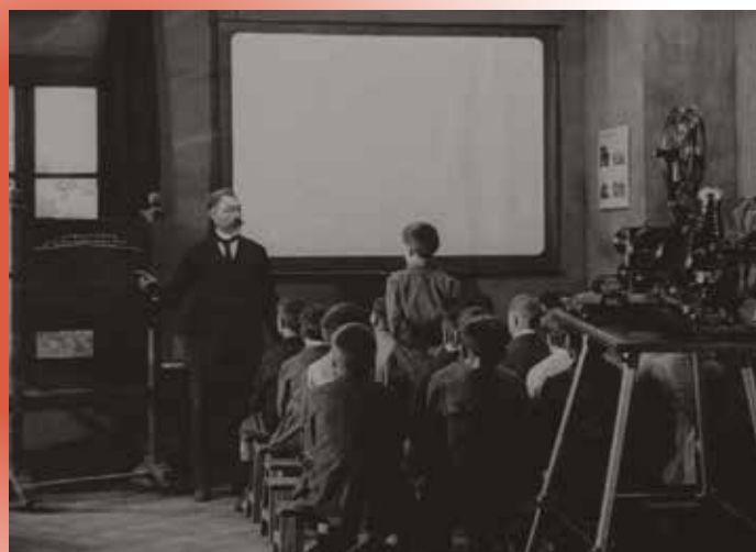
Visuel extrait du film Leçon avec projection cinématographique , 1920.