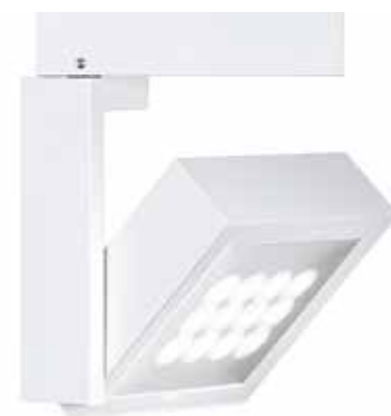
Spots LED Cantax ERCO

Les espaces ont été rafraîchis et repeints afin de laisser plus de place aux œuvres et à la scénographie que chaque exposition développe. L'intégralité du système d'éclairage a également été renouvelée de façon à offrir plus de flexibilité et à tirer parti des dernières technologies en matière muséographique. De nouveaux spots LED à variateur, au design charmant et soigné, assurent désormais aux œuvres un éclairage optimal. Enfin, une partie des vitrines d'exposition a été remplacée par des ensembles plus modulables. Leur hauteur réduite est pensée pour faciliter l'accès aux enfants et aux personnes à mobilité réduite.