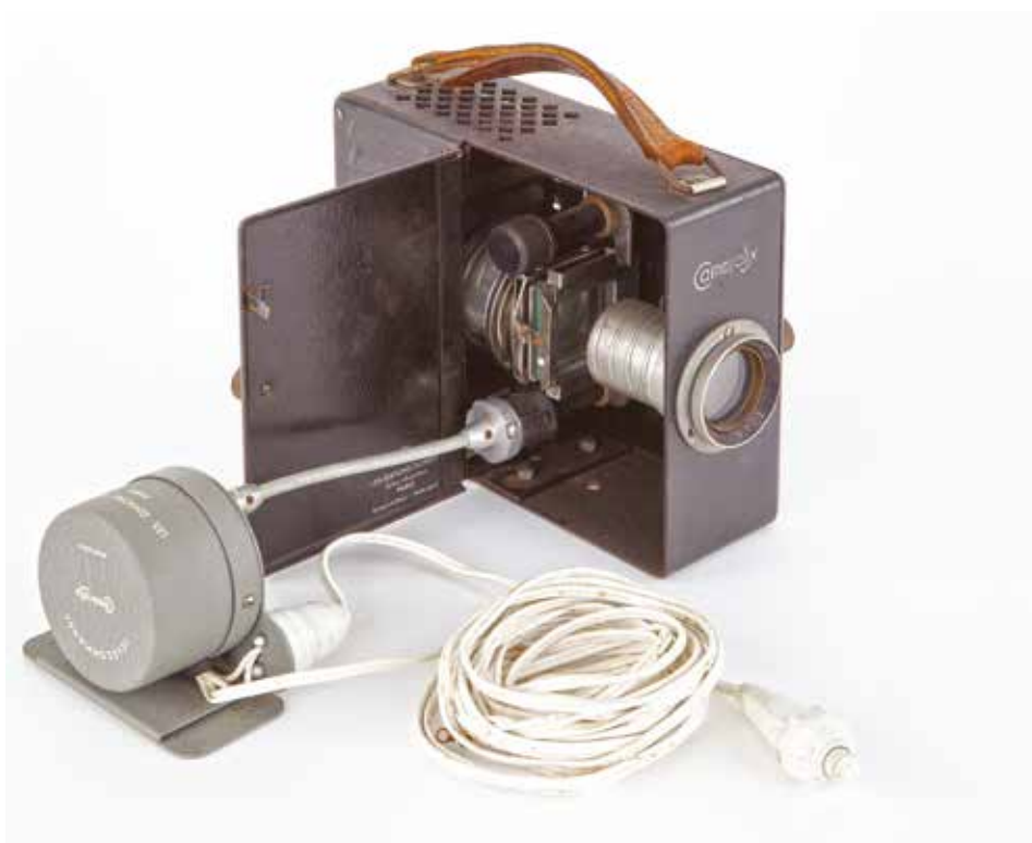
Projecteur de films fixes Camerafix et sa télécommande, vers 1950-1955.