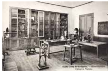
Cabinet de physique d'école avec lanterne magique. Collection particulière.

Née comme outil d'optique, la lanterne a longtemps eu sa place dans les cabinets de physique. Au XIX e siècle, la lanterne de projection prend donc également place parmi les instruments scientifiques dans les cabinets de physique des lycées. Génératrice d'une lumière puissante, elle est nécessaire aux expériences sur la diffraction de la lumière.