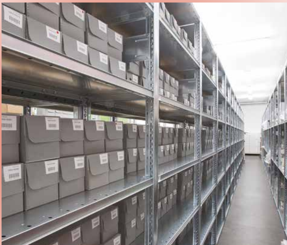
Séries de vues sur verre dans les réserves du centre de ressources du Musée national de l'Éducation.

L'exposition mobilise également largement des prêts extérieurs qui viennent éclairer et enrichir les collections du Munaé. À la liste des prêteurs institutionnels figurent la Cinémathèque française, la cinémathèque Robert-Lynen, l'Institut national de la propriété industrielle (INPI), la Bibliothèque nationale de France, le musée Henri-Barré de Thouars, la bibliothèque Sainte-Geneviève et la bibliothèque Denis-Diderot de Lyon. Toutefois, le projet repose avant tout sur une généreuse collaboration avec plusieurs grands prêteurs particuliers dont plusieurs œuvres incontournables sont rendues publiques le temps de l'exposition.