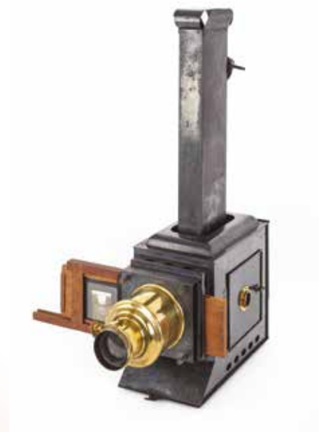
Lanterne de projection Laverne, vers 1880. Collections Musée national de l'Éducation.

Cette exposition entend valoriser les fonds audiovisuels historiques que conserve le musée , et plus précisément les collections exceptionnelles de vues sur verre et de films fixes qui ont fait l'objet d'un important travail d'inventaire et de numérisation systématique.