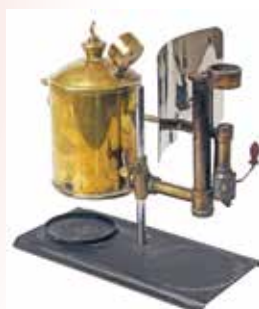
Lampe avec manchon Auer, vers 1880. Collection particulière.

L'évolution des dispositifs d'éclairage, depuis l'incontournable lampe à pétrole jusqu'à l'ampoule électrique, constituera un enjeu majeur de l'amélioration des dispositifs.