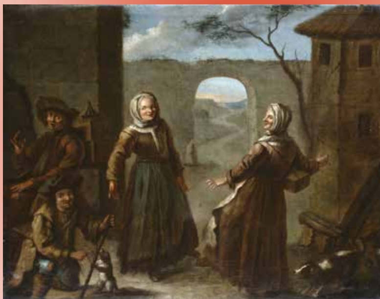
Le Colporteur de lanterne magique, fin XVIII e siècle. Huile sur toile, anonyme. Collection Hoch Frédéric.

La fin du XVIII e siècle voit l'émergence de spectacles d'un genre nouveau : les fantasmagories. Elles sont lancées par Robertson dans des salles parisiennes, et consistent à faire surgir en rétroprojection sur des tentures noires ou des murs de fumée, des figures fantastiques et effrayantes.