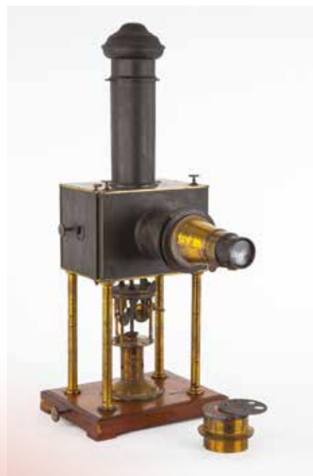
Lanterne de projection à arc électrique, Duboscq, vers 1870. Collections Musée national de l'Éducation.

Avec le développement du cinéma d'enseignement muet pour lequel Pathé, Gaumont et Éclair constituent les enseignes les plus productives, la projection fixe pour les écoles est confrontée à la concurrence, toute relative, de l'image animée.