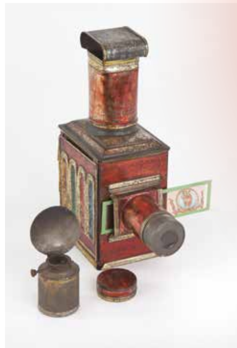
Lanterne magique « Médaillon », Lapierre, vers 1880. Collections Musée national de l'Éducation.