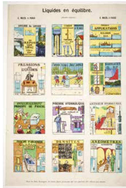
Planche de vues sur papier par Henri Arnould. « Liquides en équilibre », E. Mazo, Paris, vers 1915. Collections Musée national de l'Éducation.