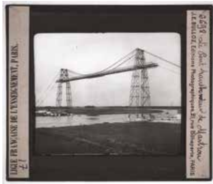
Vue sur verre pour projection, « Poitou, Saintonge, Angoumois, Vienne, Deux-Sèvres, Vendée, Charente, Charente-inférieure. Le pont transbordeur de Martrou », éditée par J. E. Bulloz, Éditions photographiques, Paris, 1903. Collections Musée national de l'Éducation.