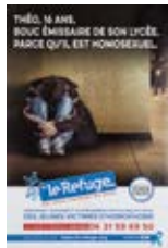
Affiche associative de l'association Le Refuge (2015).

Victimes de stigmatisation, de discrimination ou d'agression, les jeunes LGBTI+ connaissent, plus que les autres élèves, un taux élevé de décrochage scolaire et d'échec scolaire. Les conduites suicidaires sont par ailleurs quatre fois plus nombreuses pour les jeunes homosexuels et vingt fois supérieures pour les jeunes trans. Plusieurs institutions et associations se mobilisent pour lutter contre les discriminations homophobes et transphobes : la Délégation interministérielle à la lutte contre le racisme, l'antisémitisme et la haine anti-LGBT (Dilcrach), l'Organisation de coopération et de développement économiques (OCDE), l'ONAF, les associations militantes SOS Homophobie, Le Refuge, la Fédération LGBTI+, le Collectif Interséxes et Allié.es... Le 17 mai, Journée mondiale de lutte contre l'homophobie et la transphobie, constitue par ailleurs un moment essentiel de visibilité, tout comme les Marches des fiertés organisées dans de nombreuses villes.