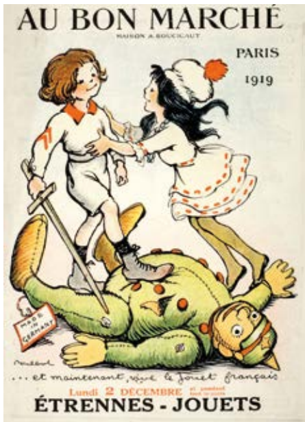
Conception : Claude Rozinoer, anciennement chargée de conservation et de recherche - co-commissaire de l'exposition.

La patrie, si présente dans les leçons d'avant-guerre, n'apparaît plus que dans le chapitre ad hoc du cours de morale. Désormais, les espoirs de l'école publique se tournent vers les perspectives de paix dont est porteuse la Société des nations. Pour autant, c'est plutôt hors de la classe que s'exprime le pacifisme le plus radical. Les aspirations de l'école sont en accord avec la politique menée par Aristide Briand en 1925, mais elles sont de plus en plus inadaptées, dans les années 1930, aux réalités de la situation internationale.