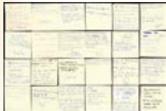
Les affiches de l'Éducation nationale réalisées par des élèves, au début d'une intervention en milieu scolaire réalisée par Le Refuge Normandie Gère Culture, École Ouvertes au sein.

En 2016 et en 2018, l'Éducation nationale a lancé des campagnes de sensibilisation dans les collèges et les lycées. Par ailleurs, des structures telles que Le Refuge, SOS Homophobie, Contact ou le Planning familial interviennent dans les établissements scolaires pour témoigner et proposer des actions collectives. D'autres actions sont également mises en œuvre : concours d'affiches dans le cadre de la lutte contre le harcèlement, vidéos, pièces de théâtre, dessins... Ainsi, depuis 2017, le Musée national de l'Éducation s'attache à faire entrer ces réalisations dans ses collections patrimoniales et les rend visibles sur son catalogue en ligne : www.musee-nl.fr/collections .