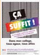
Affiche, résultat de la commande pédagogique associée de l'Éducation nationale, 2012.