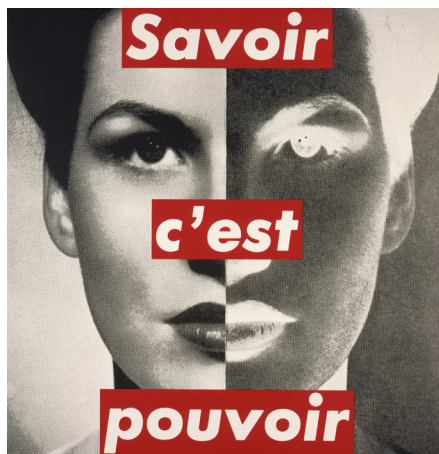
Barbara Kruger, Sans titre , 1989 FNAC 89106 (3) Commande à l'artiste en 1989 dans le cadre de la manifestation « Estampes et Révolution, 200 ans après » Centre national des arts plastiques