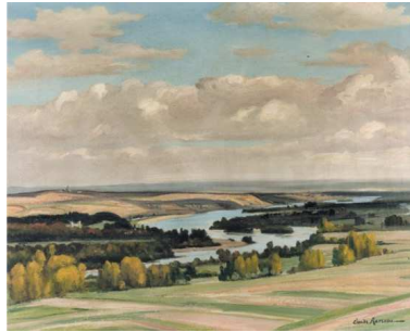
Nathàël Bierry Enola Clotilde

Au premier plan, il y a un champ. Au deuxième plan il y a des arbres et la Loire. Derrière, il y a le fleuve. Au dernier plan, il y a le ciel qui prend un peu plus de la moitié du tableau. Les couleurs sont claires, le tableau est lumineux et resplendissant.