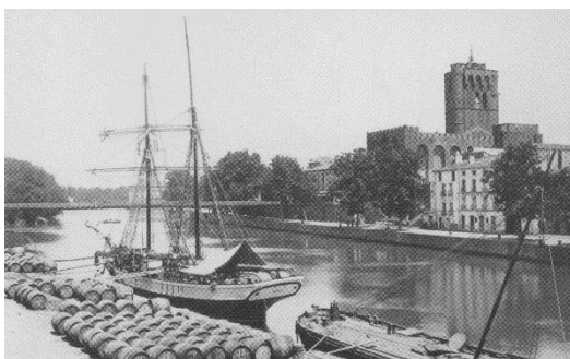
Port d'Agde sur le fleuve Hérault Vers 1910

L'équipage se retrouve près de la cathédrale Saint Étienne. Pierre décide de partir le lendemain car le vent est annoncé.