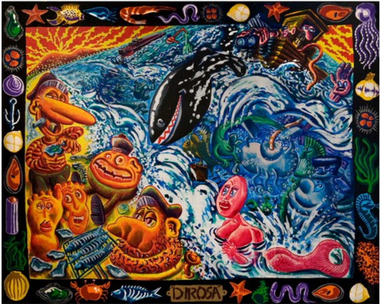
Hervé Di Rosa, Concentré sétois , 1987, huile sur toile, 200 x 250 cm

Concentré sétois est une représentation emblématique de Sète vue par Hervé Di Rosa. C'est une peinture de grand format, où éclatent les couleurs vives et joyeuses. Cette énergie chromatique traduit l'univers sétois et en particulier le monde des pêcheurs.