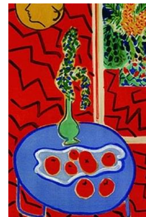
Intérieur rouge H Matisse