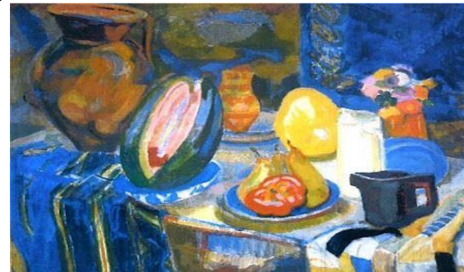
Nature morte portugaise R Delaunay

Originnaire du Nord-Ouest de l'Amérique du Sud, la tomate était donc connue en Europe dès le XVII ème siècle!