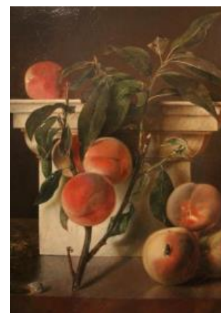
La branche de pêcher F Colin