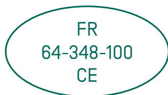
Exemple d'estampille pour la France © Copyright