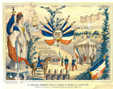
La République triomphante préside à la grande fête nationale du 14 juillet 1880, lithographie