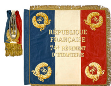
Drapeau de la République française du 74 e régiment d'infanterie, modèle remis par Jules Grévy aux armées en 1880