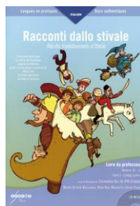
Racconti dallo stivale : livre du professeur, niveaux A1 A2 Récits traditionnels d'Italie