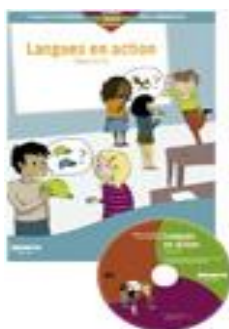
Langues en action