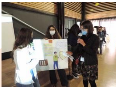
Poster COP 22

Il faut réduire tous les types de pollution, y compris numérique