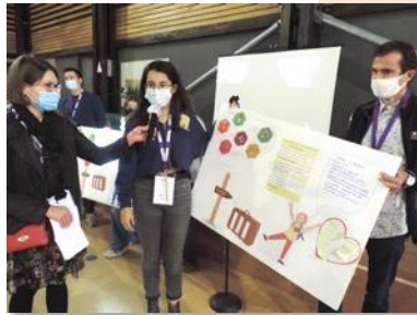
Poster COP 25

Intégrer le zéro-déchet, pour éviter que la nature ne soit prise pour une poubelle