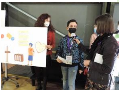
Poster COP 24

Sensibiliser aux problèmes de pollution est important, pour aider à construire un monde meilleur