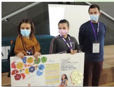
Poster COP 21