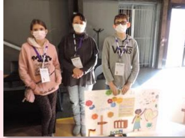
Poster COP 23