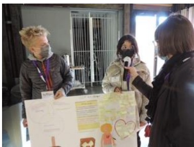
Poster COP 26

Va-t-on laisser à nos enfants un monde pollué ? Et comment aider les pauvres qui souffrent le plus de la pollution ?