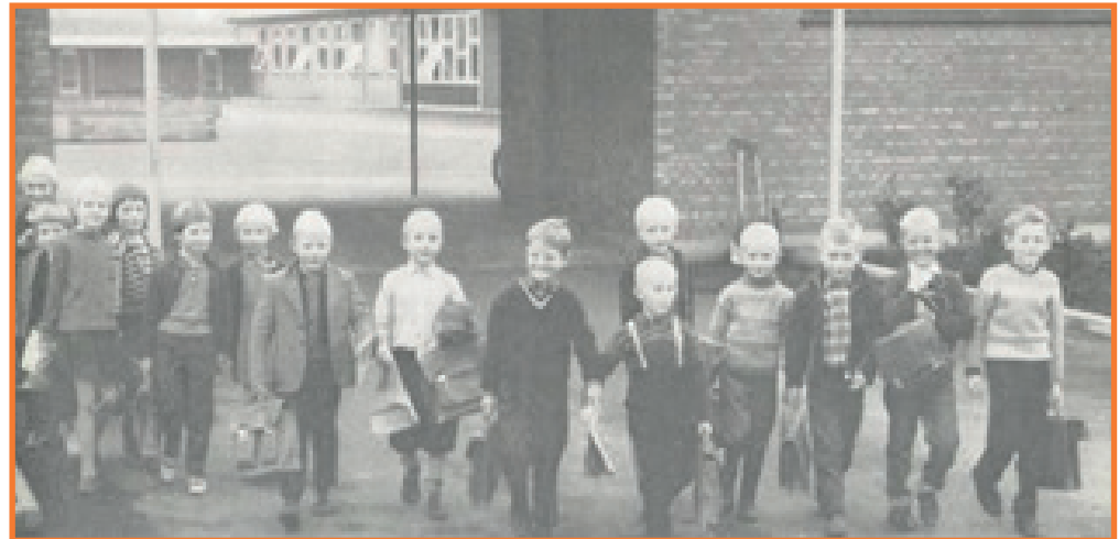
École primaire danoise dans les années 60

Historiquement, les parents ont toujours occupé une place importante dans l'éducation, les premières écoles danoises ont été créées par des parents et ces derniers ont toujours joué un rôle dans la gouvernance des établissements.