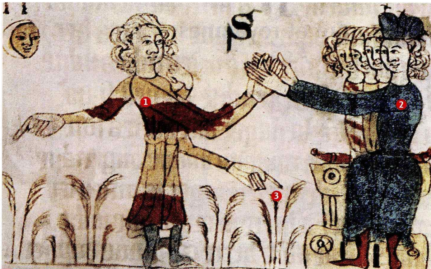
3 L'hommage et la remise du fief. (Manuscrit, début du XIV e siècle, Heidelberg.)