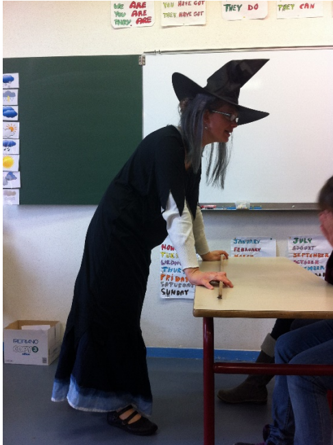
Sketch sur la rentrée des classes à l'école des sorcières.