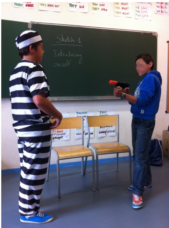
Sketch « Faire connaissance ».