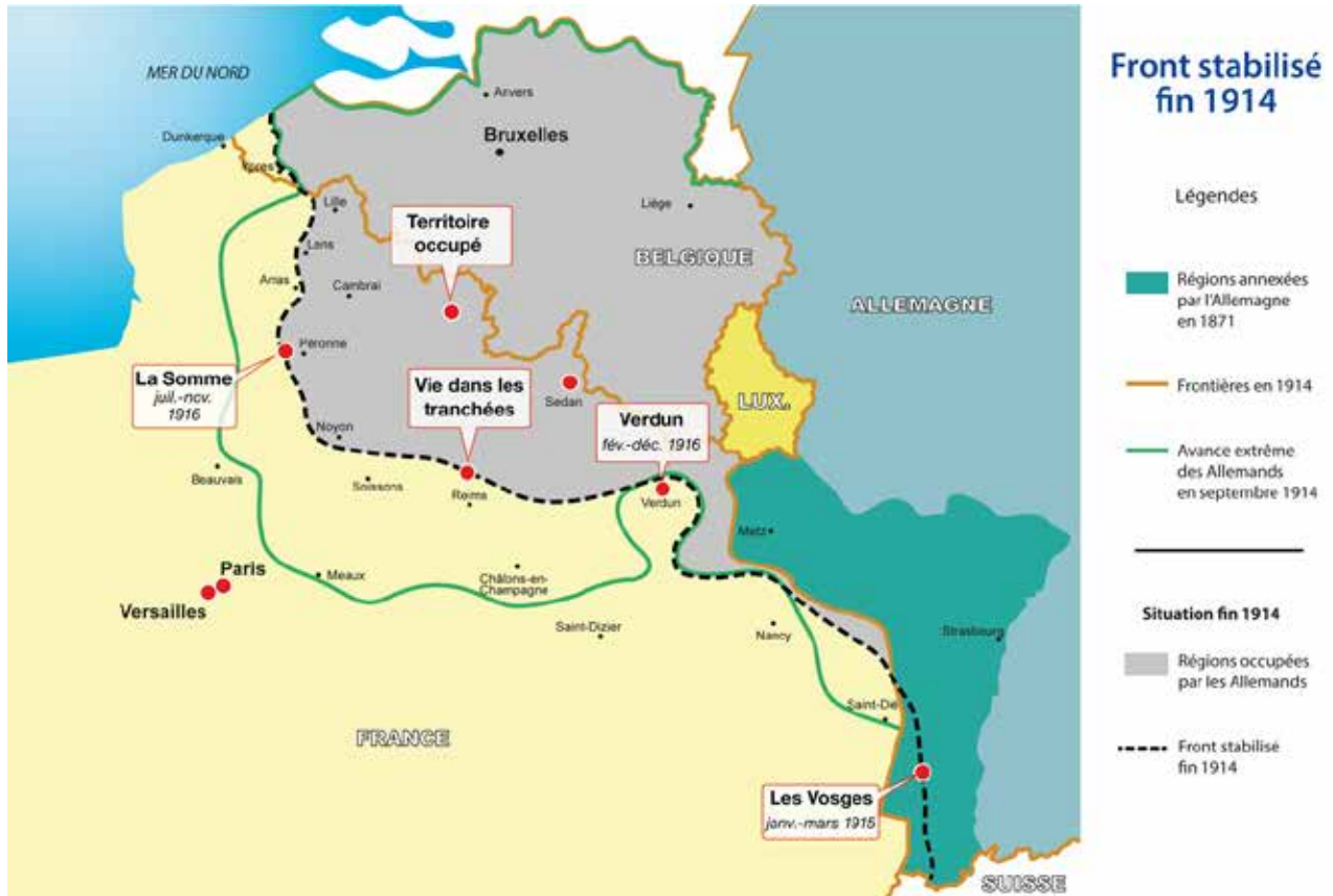
Carte générale du front entre 1914 et 1917