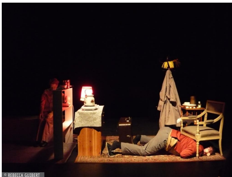
Photographie d'une répétition

Chaque acteur doit avoir au moins un point de contact avec la statue collective. Les spectateurs peuvent commenter la sculpture et tenter de la reproduire en miroir.