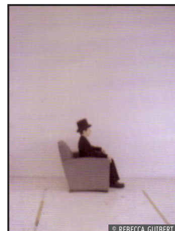
Visuel du Buveur d'éther