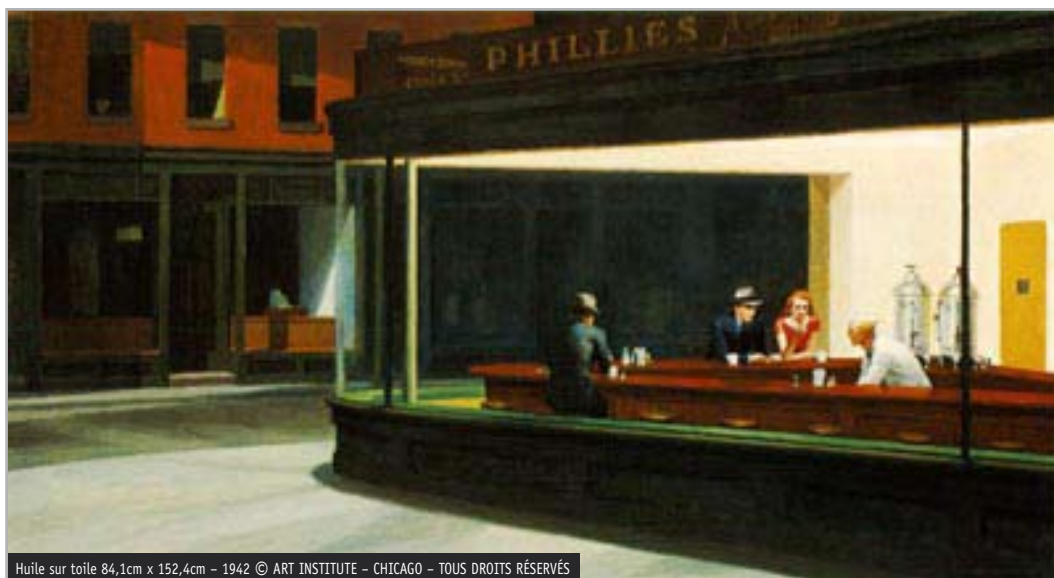
Huile sur toile 84,1cm x 152,4cm - 1942 © ART INSTITUTE - CHICAGO - TOUS DROITS RÉSERVÉS