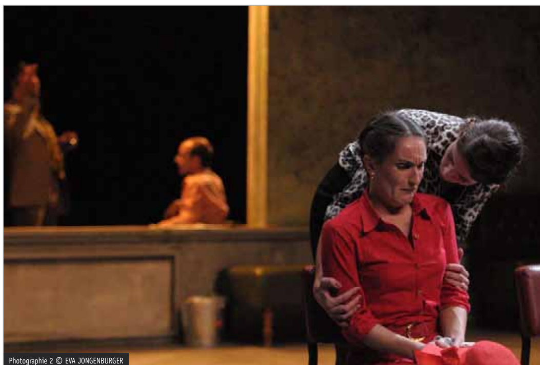
Photographie 2