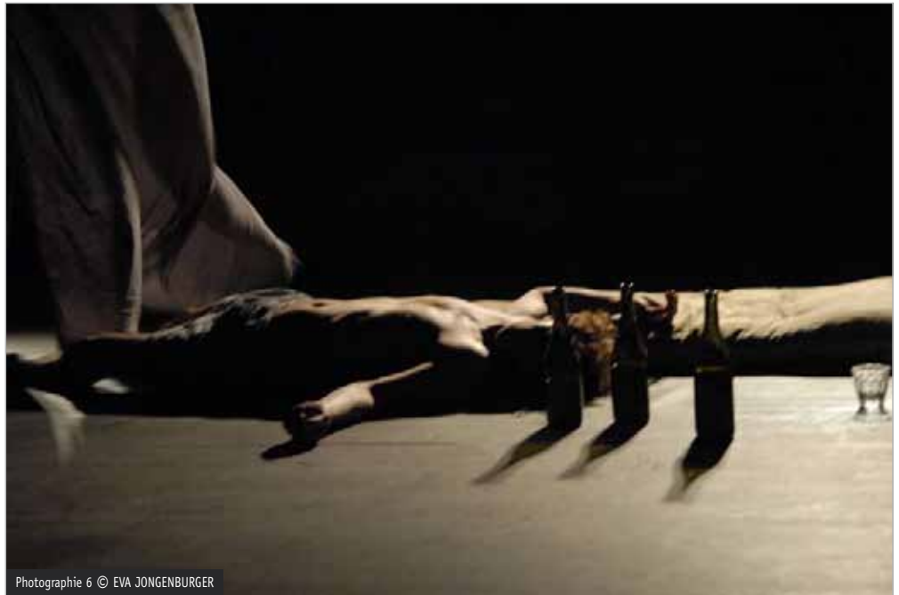
Photographie 6