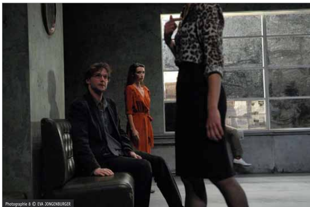
Photographie 8

A deux reprises se font entendre des voix off. Que dire de ces deux occurrences quand on comprend qu'elles précèdent les tentatives de suicide de Platonov et de Sacha ? Celle-ci met à exécution son projet à deux reprises. Celui-là pose la carabine en finissant par les paroles, acte quatrième scène 11 : « Oui, je veux vivre... ». Est-ce là, au fond, ce qu'il faut retenir de l'œuvre ? Ce que chaque spectateur trouvera de cohérence interne à la représentation et y mettra de lui-même ?