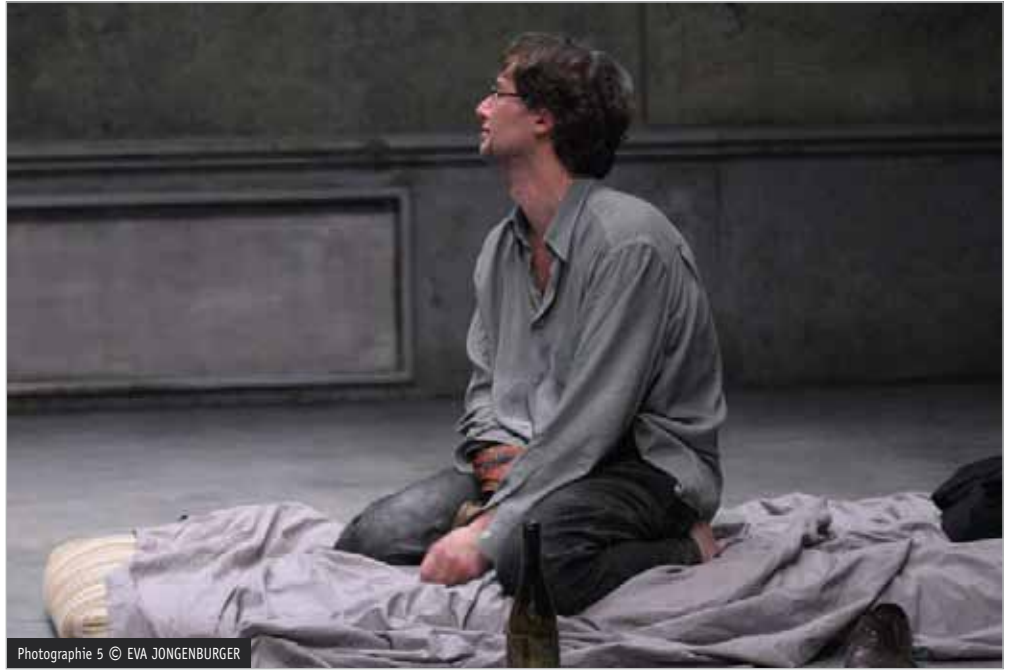
Photographie 5