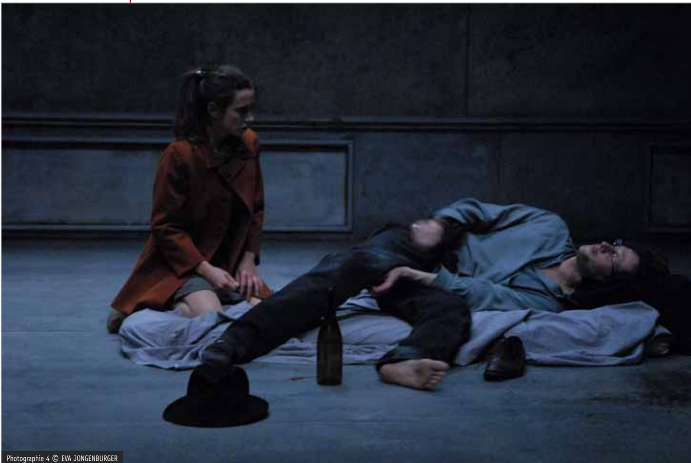
Photographie 4

Le comédien jouant Platonov use, lui, principalement de trois registres : entre le hurlement, la voix parlée et l'émotion contenue qui se révèle par un léger érailement, soulignant l'effort fait pour retenir l'expression de la fragilité, de l'émotion ou celle de la colère. La gorge se noue, le personnage se freine.