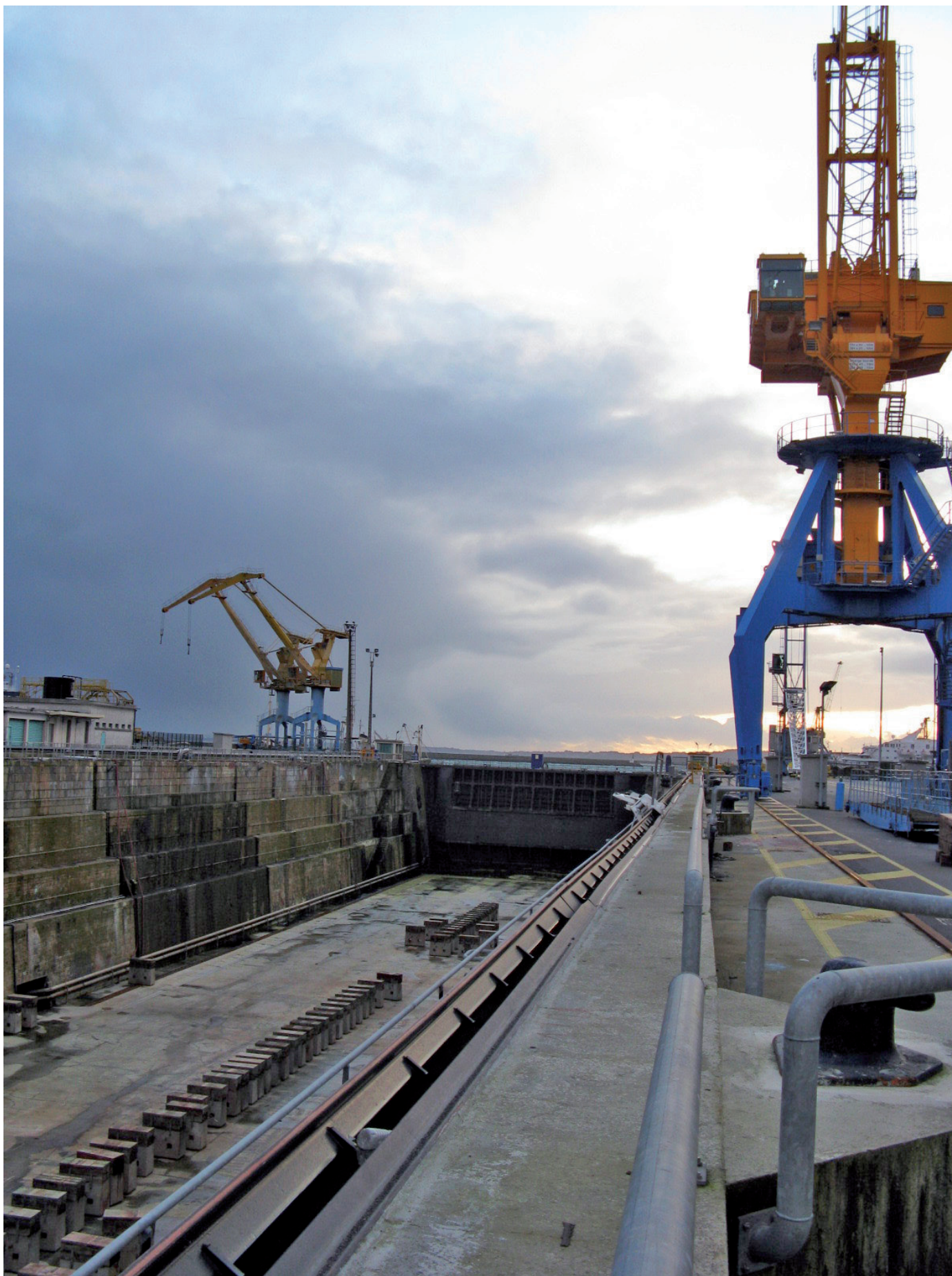
► Ar poull-sec'h evit degemer ar bigi da vezañ dreset.