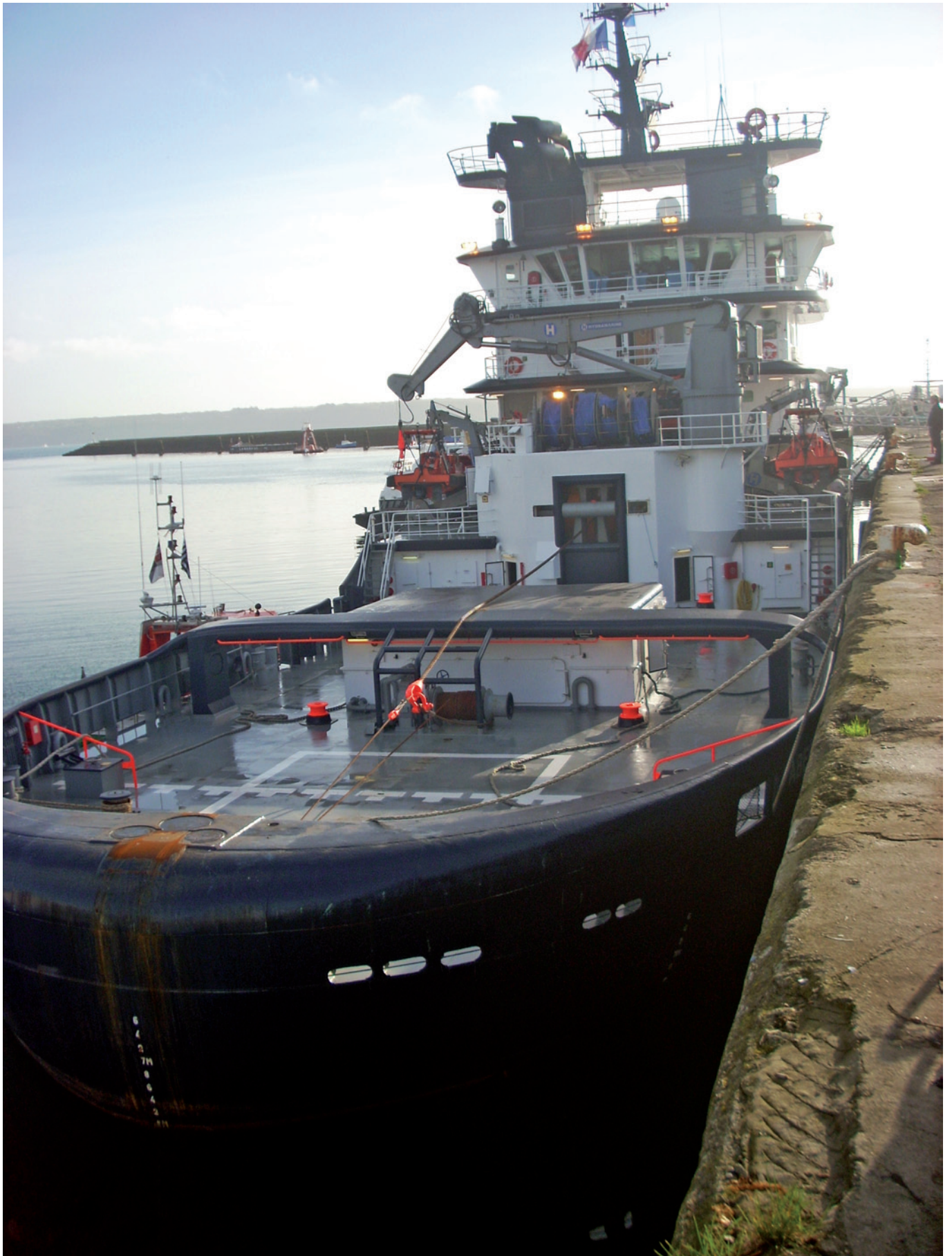
► Al lestr Abeille Bourbon zo ur vag-savetaj bras-meurbet. Gouest eo da verdeiñ war ur mor dirollet dindan forzh peseurt amzer.