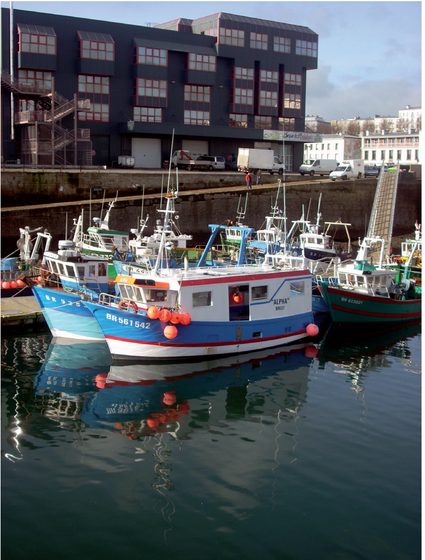
Bigi evit ar besketaerien zo e Brest. Pesked, kregin, kranked a vez pesketaet ganto.