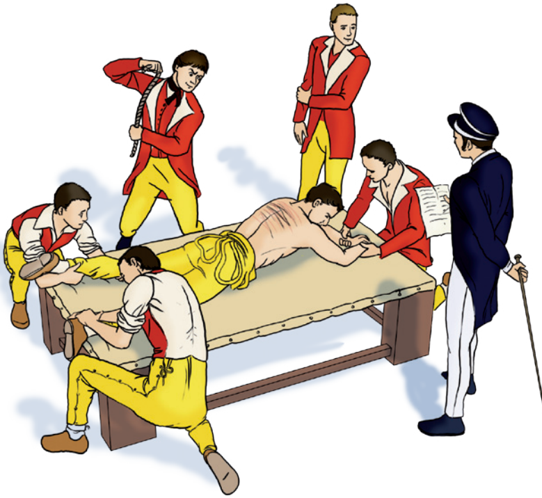
► Taolioù skourjez a veze roet d'ar brizonidi p'o doa disentet.